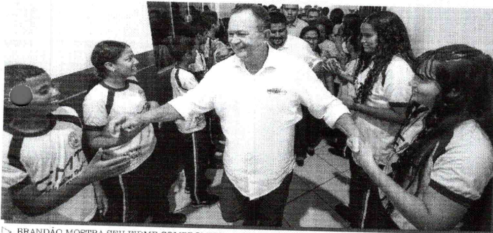
BRANDÃO MOSTRA SEU FIRME COMPROMISSO COM A EDUCAÇÃO NO MARANHÃO

Com essa iniciativa, o governo do Estado reafirma seu compromisso com a melhoria da qualidade da educação no Maranhão