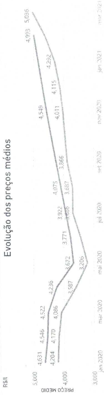
Evolução dos preços médios