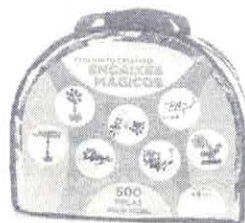
Anexo empresa Service (RECORRENTE)

CONJUNTO CRIATIVO ENCAIXES MÁGICOS - CONJUNTO COM 500 PEÇAS CONFECCIONADAS EM PLÁSTICO POLIPROPILENO ATÓXICO DE ALTO BRILHO E CORES VIVAS. APRESENTA DIVERSOS ENCAIXES, NOS FORMATOS: ES TRELA COM SEIS PONTAS ARREDONDADAS, PINO COM TRÊS PONTAS ARREDONDADAS, PINO COM DUAS PONTAS ARREDONDADAS, PINO TRIPLO COM SETE PONTAS ARREDONDADAS E ANEL COM SEIS ENCAIXES. ACONDICIONADO EM SACOLA DE PVC CRISTAL COM ZIPER E ALÇA.